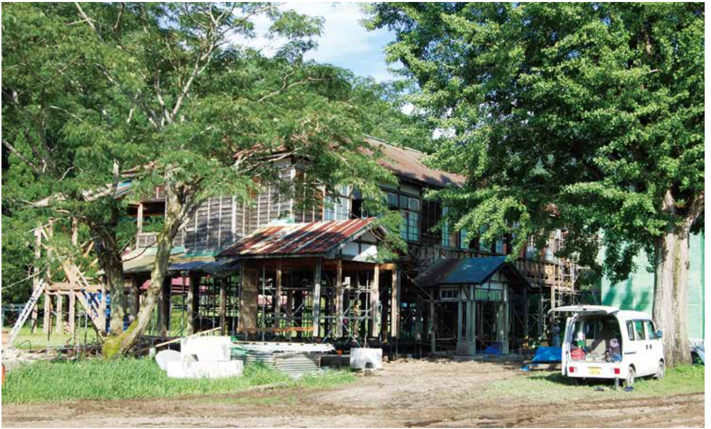
耐震工事中の旧喰丸小学校。1980年に廃校になり、解体が決まっていたが、「ハーメルン」で使わせてほしいとの申し出に、保存が決まった