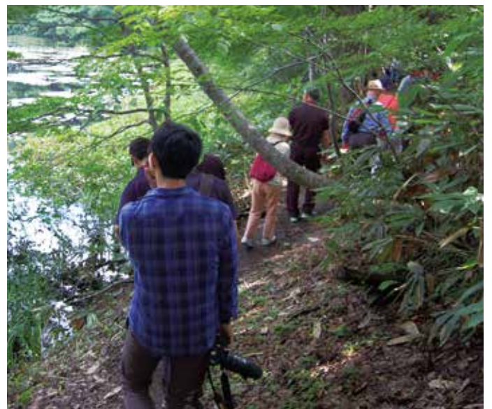
足元に注意しながら散策コースを歩く塾生たち