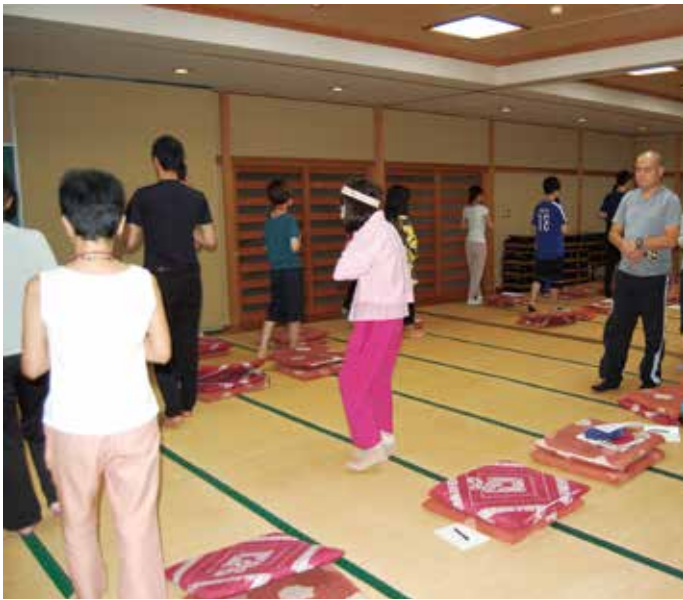
坐った後は5分間の歩行禅。これを経行（きんひん）という