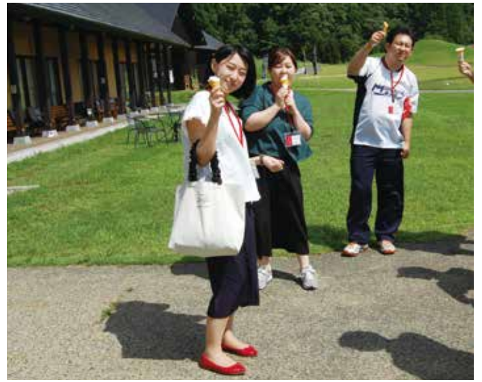
道の駅ではお土産を買ったり遊んだり、息抜きタイムを取る