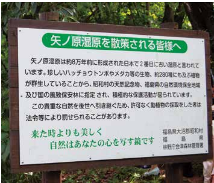
矢野原湿原は日本で2番めに古い湿原だそうだ