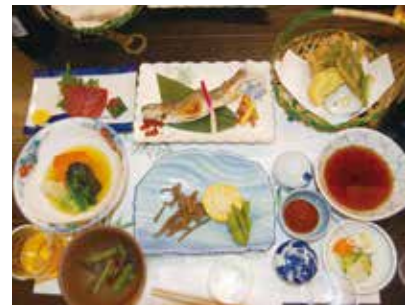
打ち上げの席を盛り上げた郷土料理。この他に裁ちソバ、ご飯セット、デザートも付く