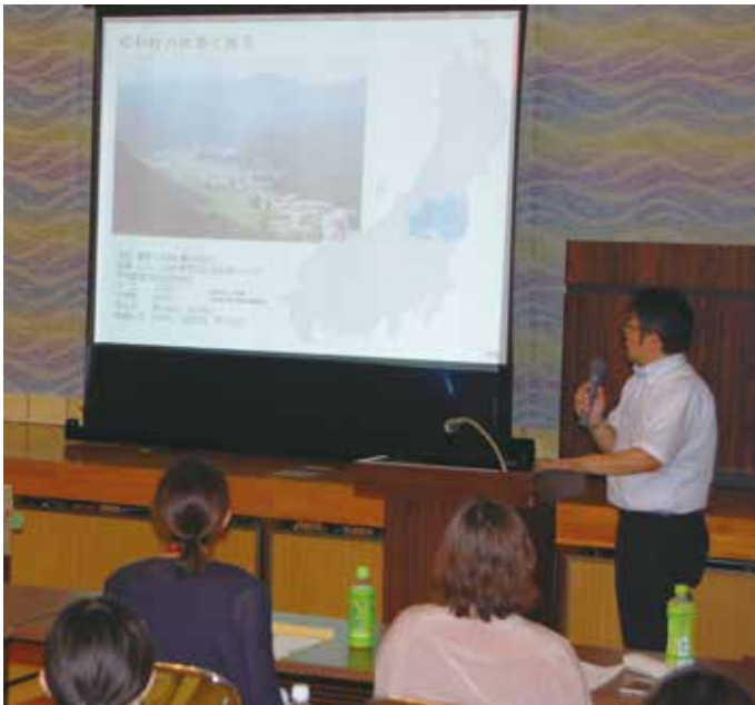
昭和村の実情を話す星からむし振興室長