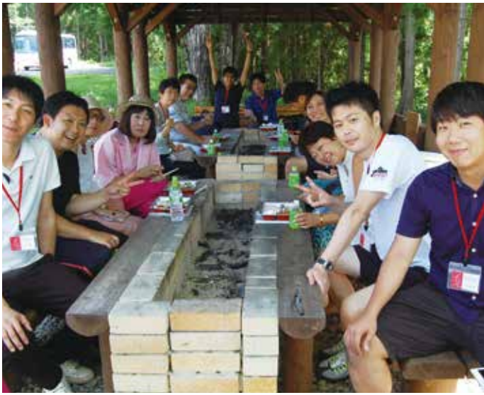
屋外バーベキューコーナーで特製弁当に舌鼓を打つ