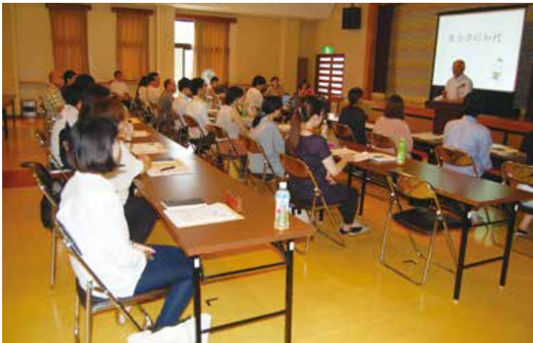
合宿の皮切りは開講式。「しらかば荘」の羽染支配人が「静かで何も無い村だが、それが財産。疲れを癒してほしい」などと歓迎の挨拶を述べる

25日は東京方面からの塾生が顔をそろえた午後4時前から、隣接の「しらかば会館」を会場にして、開講式、オリエンテーション、昭和村を舞台にした映画「ハーメルン」上映会、坐禅を行いました。昭和村は奥会津に位置し、日本の原風景として、「からむし織の郷」として知られている山村ですが、人口の60%は高齢者という限界集落です。