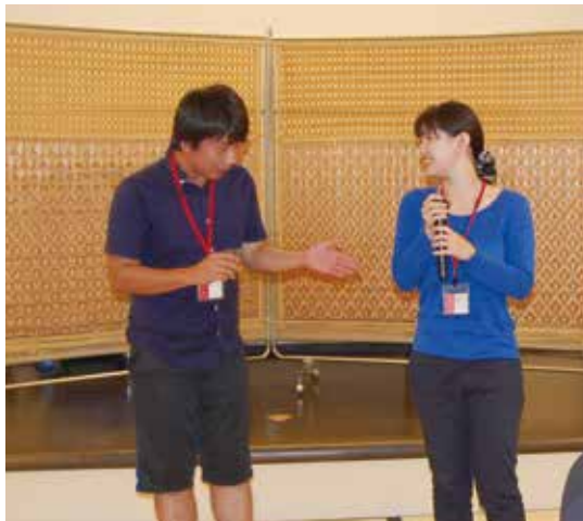
夫婦そろって塾生になった「あつまる」の空閑夫妻