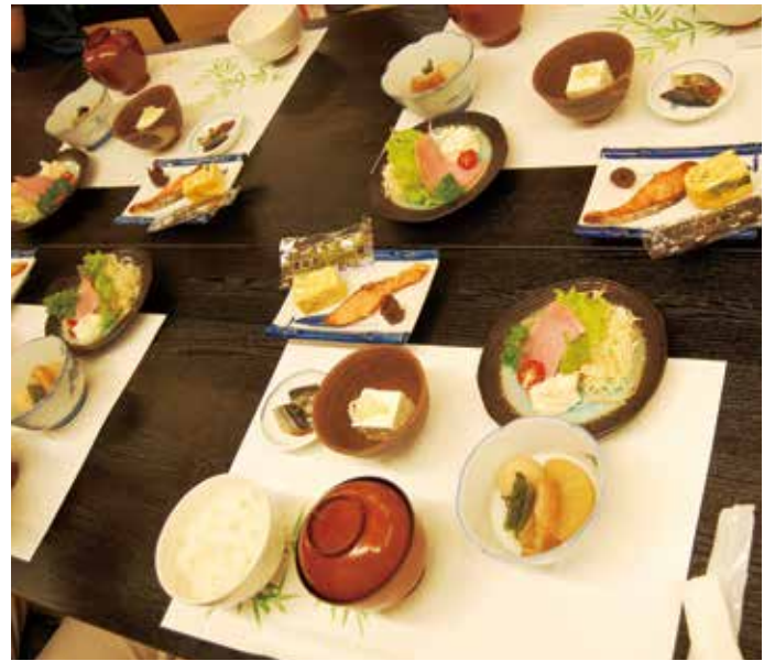
地の食材を使った初日の夕食。この他に野菜天ぷら、変わりご飯、みそ汁、デザートもつく