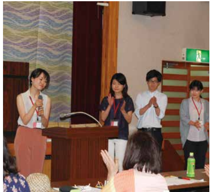
入塾動機や決意を披露する新入塾生たち