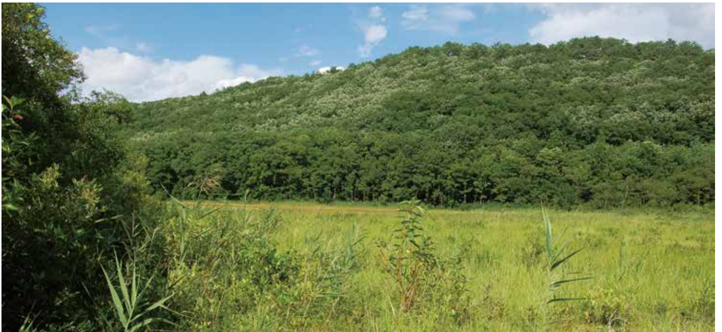
圧倒的な存在感で迫る矢野原湿原。クマのフンが転がっていたり、キノコが顔を出していたりと自然がいっぱい。湧水も豊富で飲み比べを試みた塾生も