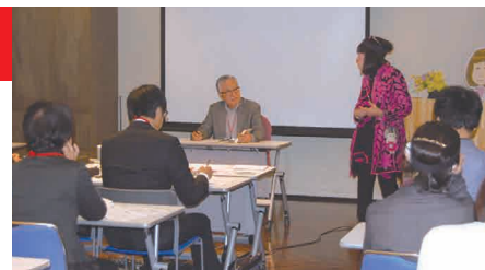
「生き方」のプロローグを読んだ輪読会

仏教には「思念が業をつくる」という教えがある。思ったことが原因となり、その結果が現実になって表れてくる。人生は心に描いた通りになる、強く思ったことが現実となって現れてくる——この「宇宙の法則」を心に刻みつける。良い思いを描く人には、よい人生が開けてくる。悪い思いを持っていけば、人生はうまくいかなくなる。「よかれかし」という利他の心、愛の心を持ち、努力していけば、宇宙の流れに乗っ