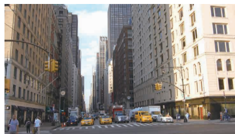
最近のニューヨークでは空車のタクシーも少なくない

車を頼めば、後何分後に着きます、運転手はこういう人ですと画像で知らせてくる。安心して利用できるのです。だからシェア