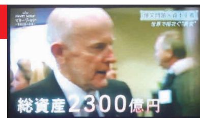
総資産2300億円の大富豪

・国家を上回る富の力で市場に君臨するグローバル企業。南米では巨大企業に訴えられ、追い詰められる国も出ている。 ・ヨーロッパに拡大する深刻な失業率、見えない将来への不安と怒りが渦巻いている。